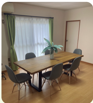
●ダイニングルーム

各居室にエアコンを完備しています。 ご希望によりベッド、テレビ、冷蔵庫の レンタルが可能です。定員は6名。 共有スペースとして、トイレ×2、お風呂×2、 洗面所×2、洗濯機×2、乾燥機×2がございます。