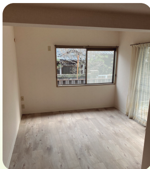
●個室(1階南側の洋室)